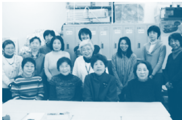
▲聴くの会のメンバーのみなさん

『聴くの会』は、市内にお住まいのひとり暮らし高齢者の方に電話で友愛訪問活動を行っているグループです。 月に一度の電話訪問で、ご利用者の近況などをお聞きしながら、世間話を楽しんでいます。