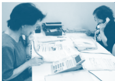
▲メンバーが利用者の話をじっくりとお聞きします

『聴くの会』は、市内にお住まいのひとり暮らし高齢者の方に電話で友愛訪問活動を行っているグループです。 月に一度の電話訪問で、ご利用者の近況などをお聞きしながら、世間話を楽しんでいます。