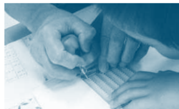
▲点字を作成している小学生