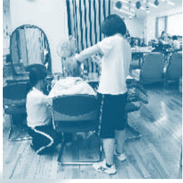
▲ドライヤーをかけている様子

「ボランティアをしてみたい」と考えている方を対象に、一日から参加できるボランティア体験プログラムを実施し