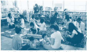
▲お母さん同士の輪が広がります