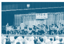
▲昨年の様子(刀根山校区)