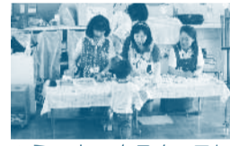
▲ミニカーをスタッフに見せに来る子ども