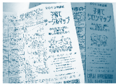
▲子育てサークルマップ・サロンマップ http://www.toyonaka-shakyo.or.jp/

市内の38小学校区では、校区福祉委員会が、月1回程度、地域の親子が集う子育てサロンを開いて、絵本の読み聞かせや季節の行事などを行っています。 一方、市内には、たくさんの子育てサークルがあり、親子で集まって、公園で遊んだり、室内で手遊びや工作、音楽遊びをしたりしています。 ぜひ一度、マップを手にとり、ご自分の校区の子育てサロンやお近くの子育てサークルを探して、のぞいてみてください。子育て中のお母さんや、