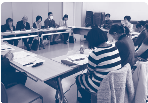
▲検討委員会のようす

3月には生活支援サービス協力会員・安心協力員の合同研修交流会を行い、意見をいただきました。それらの結果を踏まえ、平成28年度中に生活支援サービスのルール変更を予定しております。