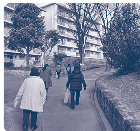
▲民生委員・校区福祉委員・包括支援センター・社協CSWで訪問しました。

訪問を進める中で、市の一人暮らし登録の紹介をするなど新たなつながりが生まれています。