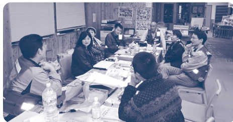
▲西原村災害ボランティアセンターへの支援

4月14日、16日に発生した熊本地震に対し、豊中市社協は街頭募金を始め、4月19日時点でのスーパー、コンビニ、生協から佐賀県武雄市経由での水の配送。