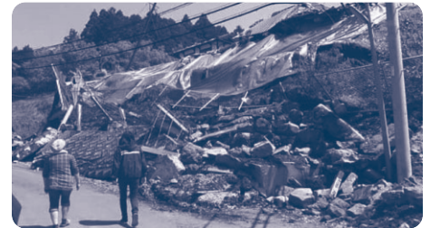
▲全壊家屋への訪問調査活動の支援