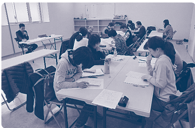
▲バンク登録者研修(事例検討)の様子

「ボランティア活動をきっかけに、市民後見人の活動に興味を持ちました。不安もありますが、専門相談等で適切なアドバイスをいただいています。そしてご本人の代理者として様々な支援活動を行うことに、身が引き締まる思いです。」とおっしゃっていました。