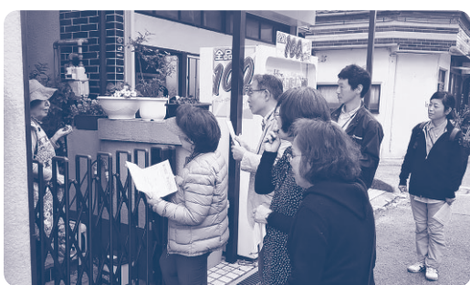
▲1軒ずつ丁寧に訪問をしています。

担当の民生・児童委員一人では普段訪問できない家や、家族構成が変わり、以前は家族と同居していたが現在はひとり暮らしになっている人、介護疲れでサービスを必要としている人などへ情報を届けています。