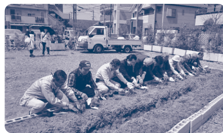
▲開園式でキュウリの苗を植える関係者ら