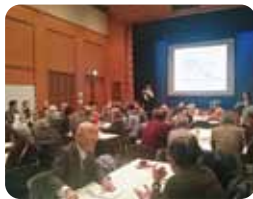
マンションサミット 交流会