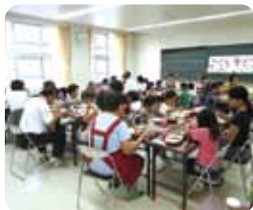
子ども食堂 (子どもの居場所づくり)