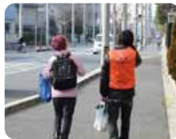
豊中びーのびーの プロジェクト (若者が買い物のお手伝いなど)