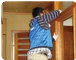
福祉便利屋事業 (高齢者の困りごとを手伝う)