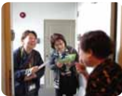
地域見守り ローラー作戦