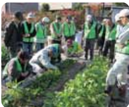
豊中あぐりプロジェクト (男性の社会参加)