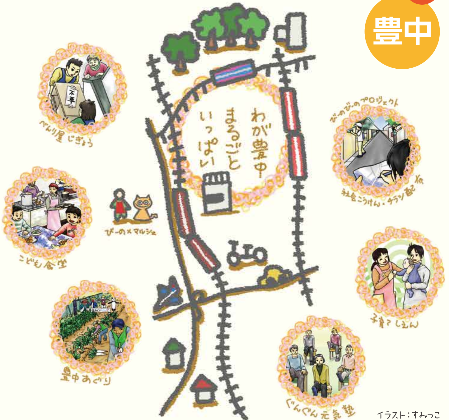
イラスト: すみっこ