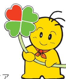
豊中のボランティア イメージキャラクター「ポランちゃん」