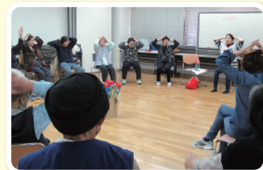
笑い声が絶えない、介護予防出前教室