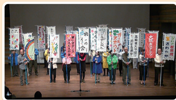
ボランティアフェスティバルオープニングの様子