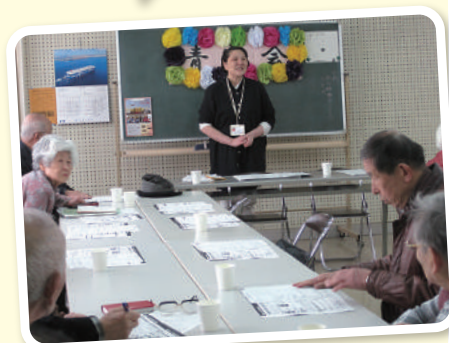
庄内西校区「青空会」でのふれあい出前講座