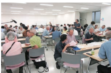
マンションサミット