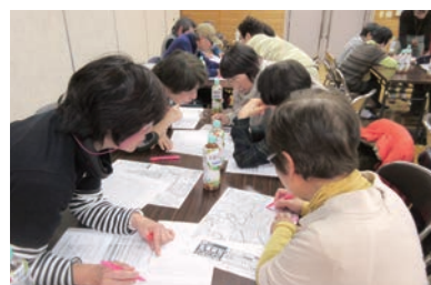
避難行動要支援者把握図上訓練