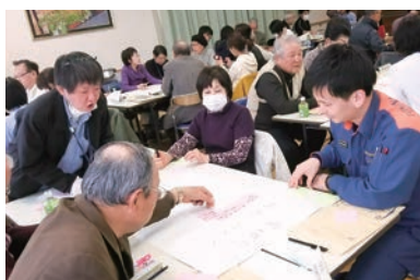
地域福祉ネットワーク会議