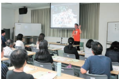
子ども食堂サポーター講座