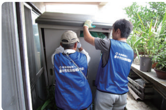
ボランティアセンターの運営(災害支援)