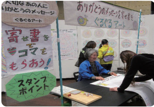
ぐるぐるアート体験(昨年の様子)