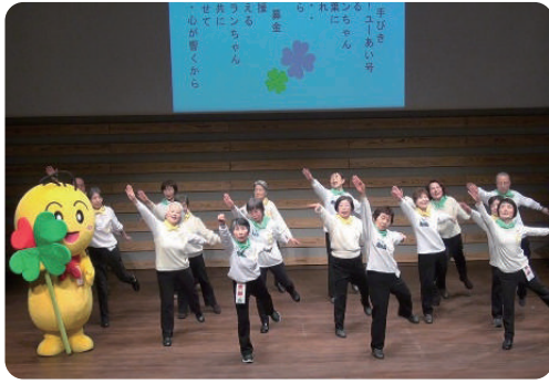
歌体操を披露(昨年の様子)