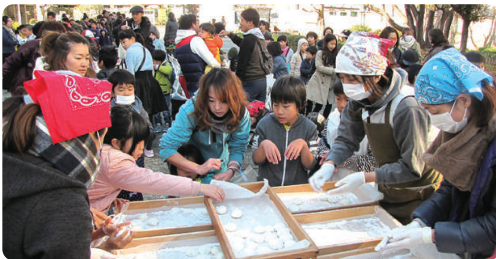
みんなで楽しくおもちつき 世代間交流(北条校区)