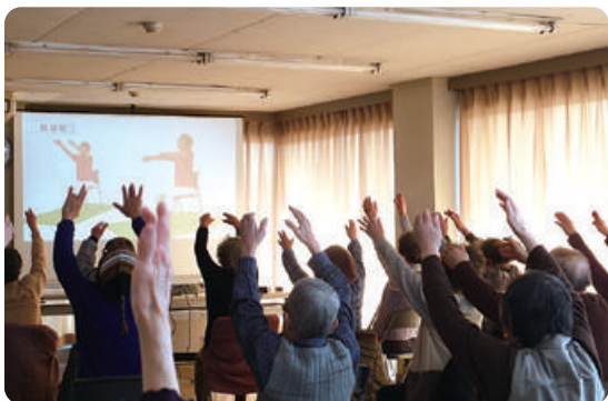
ぐんぐん元気塾(北丘校区)