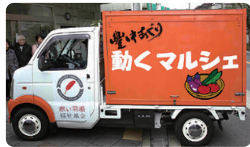
オレンジの車体が目印です!

平成30年12月から、赤い羽根共同募金を活用して移動販売車を導入しました。この車は、市内で買い物困難な地域などに豊中あぐりの野菜をおすそ分けする形でお届けしています。また、びーの×マルシェの商品(パン・こんにゃく・お菓子等)をお届けしています。