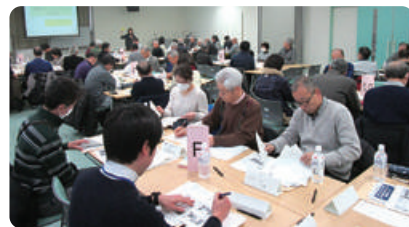
マンションサミット交流会(31年2月)

マグネットシートを自治会や自主防災会などの防災に役立ててみませんか(一定条件あり、先着順)