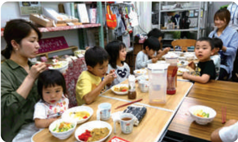
子ども食堂が市内21か所に