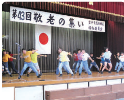
昨年度の様子(庄内校区)

来場者用参加品の準備にあたり、封入作業等でみなさまのご協力を得るために内職広場を開きます。敬老の思想とともに、高齢者の社会参加促進に寄与する事業として位置づけています。