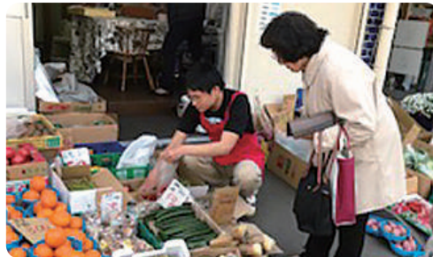
ひきこもり経験者が販売員に