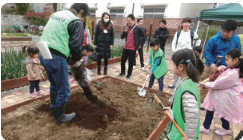
子ども向け農業体験 豊中青年会議所と共催