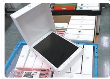
各校区福祉委員会に タブレット端末を配布