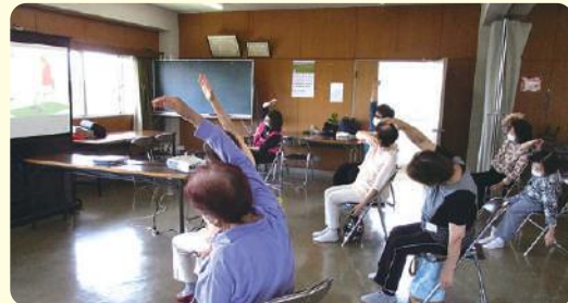
★少人数に限定して開催(桜井谷)