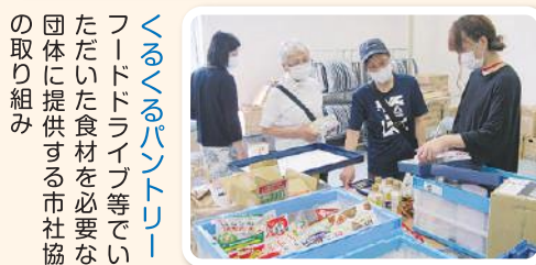
くるくるパントリー フードドライブ等での いただいた食材を必要な 団体に提供する市社協 の取り組み

フードドライブを困窮者 支援に活用しています 近年社会問題となつてきている食品ロスをなくす取り組みとして、「フードドライブ」を続けています。スーパー内の回収ボックスへ市民の皆さまから食品の寄付をいただき、必要な方や子ども食堂へお渡しをしています。 (株)ダイエーと生活協同組合コープこうべに加え、10月から新たに(株)光洋に参画いただいています。開催店舗は下記の通りです。 回収ボックスを見かけられた際は、ぜひご協力ください。