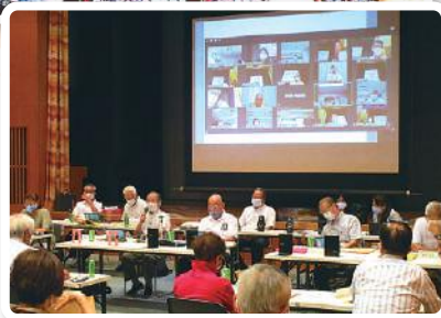
校区会長会もオンライン開催