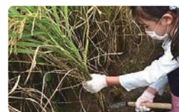
★稲刈り体験(あぐり) たいへんだったけど とても楽しかったよ