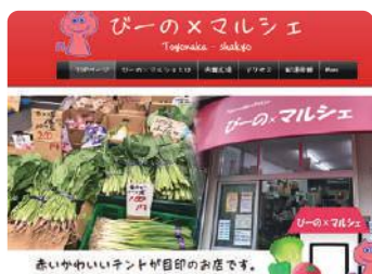
赤いかわいいいんどが目印のお店です。