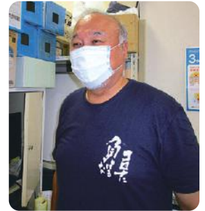
作業所作成Tシャツ