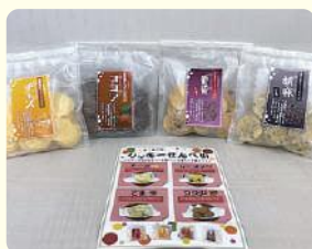
クッキーせんべい 1,000円