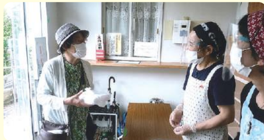
★テイクアウトやお届け方式へ(豊島北)