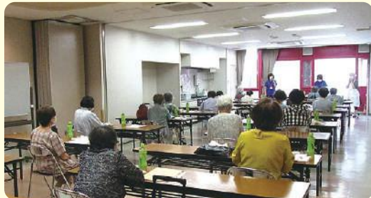
★座席の間隔を空けて(大池)