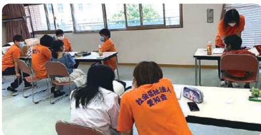
★間隔を空けて学習支援(愛和会)