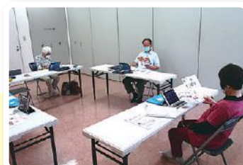
ひとり暮らし 老人の会 リモート役員会