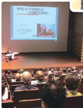
ささえ愛 ポイント研修会 リモートで13校区 100名以上が参加