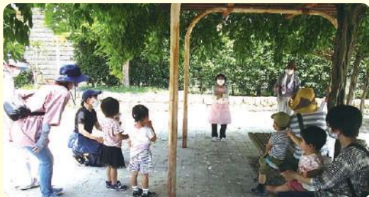
★屋外で距離を保って(野畑)