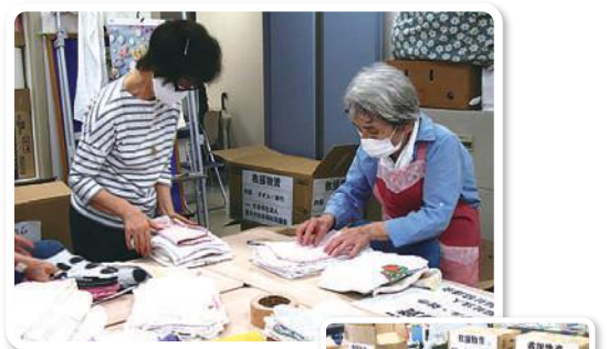
ボランティアさんによる仕分け作業

泥出しなどで利用できるタオル・雑巾の寄付を募った結果、わずか半月ほどで8,642枚お寄せいただきました。