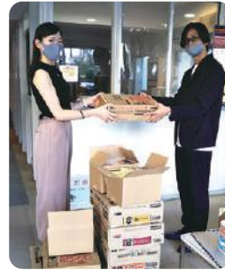
大学生に食材支援

また、コロナに負けるなロゴ入りポロシャツ・Tシャツは受注が少なくなった障害者作業所の新たな商品開発に結び付きました。