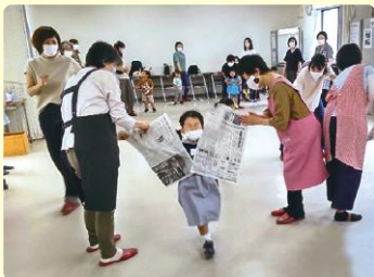
子どもたちののびのびと (泉丘校区)