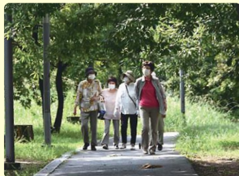
体力と気分もアップします (東豊台校区)