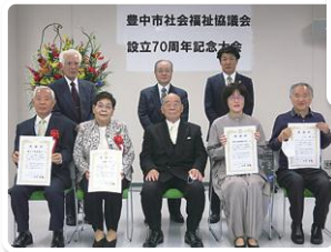
ご代表に感謝状贈呈