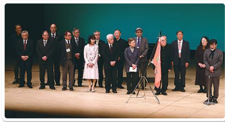
第12回 全国校区サミット in 豊中(平成31年) 全国から2,300人が参加

スタート、福祉公社との統合、大阪北部地震等災害対応、そして新型コロナウイルス感染拡大における支援等その時々時代の課題に向き合ってきました。これまで事業を支えていただきました皆様に感謝を申し上げますとともに、引き続き住民主体の誰一人取り残さない地域づくりを進めてまいります。