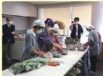
安心安全な食事づくりを 模索中(桜塚校区)