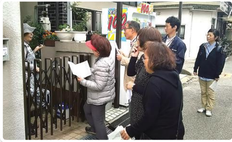
見守りローラー作戦 孤独死をなくすために(平成25年~)

スタート、福祉公社との統合、大阪北部地震等災害対応、そして新型コロナウイルス感染拡大における支援等その時々時代の課題に向き合ってきました。これまで事業を支えていただきました皆様に感謝を申し上げますとともに、引き続き住民主体の誰一人取り残さない地域づくりを進めてまいります。