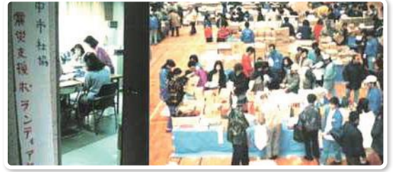
震災支援ボランティアセンターの設置と活動(平成7年)

豊中市社会福祉協議会は今年で設立70周年を迎えます。校区福祉委員会の設立、阪神・淡路大震災後の震災支援ボランティアセンターの設置、小地域福祉ネットワークの全市展開、コミュニティソーシャルワーカー(CSW)事業の