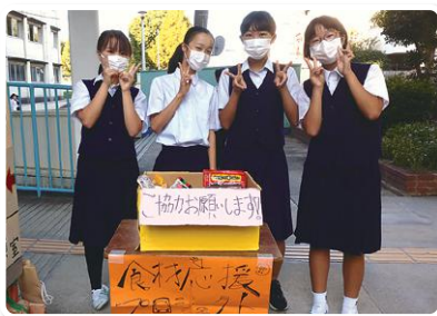
第16中学校でも生徒中心に取り組みされました

食品ロスの削減にもなるこの取り組みは市内のスーパーで実施されています。また、ボランティアセンターぷらっとでも第1月曜日(1月は1/17)に窓口を開設します。ぜひご協力ください。