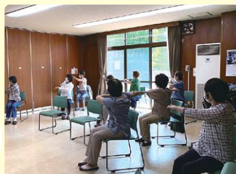
介護予防に効果抜群です (少路校区)