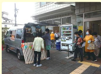
巡回依頼がますます 増えています(南桜塚校区)