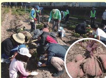
地域共生ファームとして 様々なメンバーがつながりました