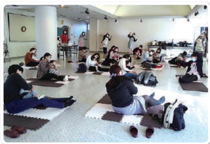
▲参加者同士の距離をとって 子育てサロンももちゃん(東泉丘)