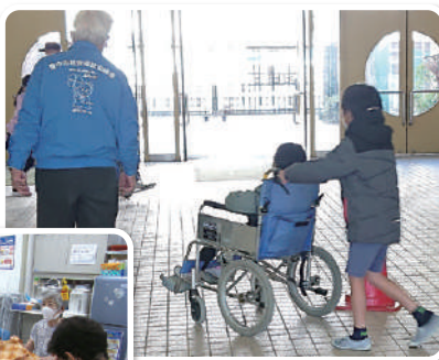
◀小さな手 介護する人の声を個別に ききながら介護用品を 作成しています