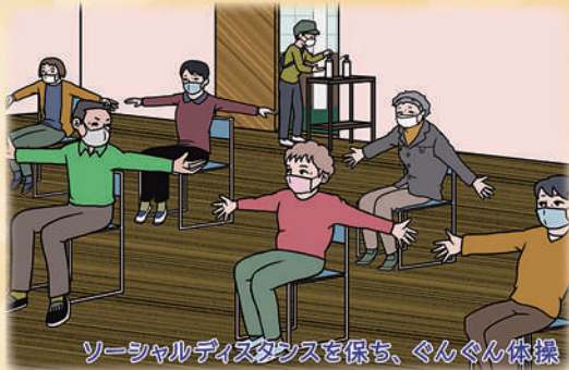
ソーシャルディスタンスを保ち、ぐんぐん体操