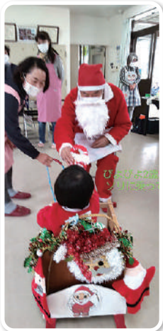
▲サンタさんに 子どもたちも大喜び (泉丘校区)

届けたい・つながりたい子育てサロン情報 コロナ禍で、なかなか再開できなかった子育てサロン。親子で安心して出かけた、他の親子と出会いたい。校区福祉委員会ではお母さんたちの声を聞きながら、どうやったら安心してサロンができるかやICTを使って会えなくても情報を伝える方法を試行錯誤してきました。 ようやく緊急事態宣言も解除になり、子育てサロンも徐々に再開してきています。