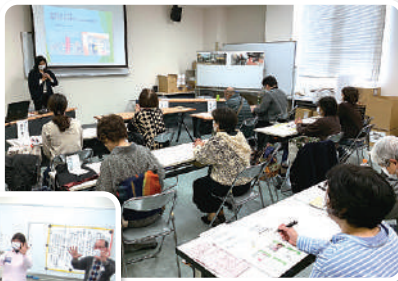
ボランティア▶ はじめの一步講座 ボランティア初心者 向けの講座を開催