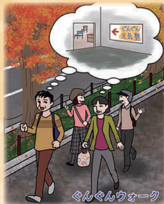
ぐんぐんウォーク