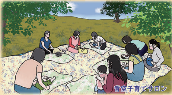
青空子育てサロン