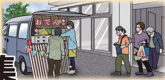
キッチンカーを使ったテイクアウト