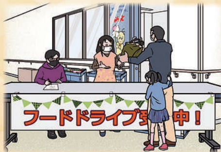
子ども食堂等へフードドライブ