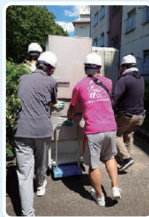
ボランティア活動の様子(引越の支援)