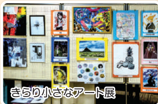
さらり小さなアート展