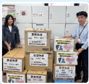
令和6年9月、現地の要請を受けて石川県にタオル、雑巾を送付しました。

◆「被災地に関心を持ってほしいという現地の方々の言葉を忘れず、今度は自ら能登に足を運ぼうと思います。」