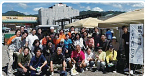
輪島市災害たすけあいセンターにて