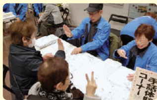
過去のボランティアフェスティバルの様子

【午前】福祉大会(表彰状・感謝状贈呈、記念講演) 記念講演「地域共生社会の実現に向けて」 すべての人に居場所と出番づくり」 講師 関西学院大学名誉教授