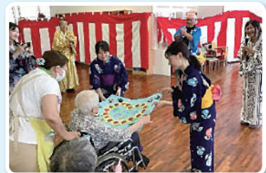
子ども達からの応援メッセージを届けました。