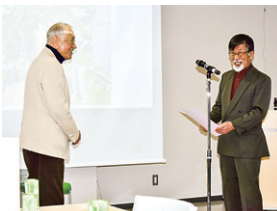
協力者へ感謝状を贈呈