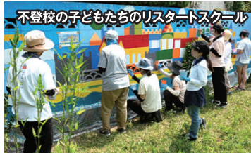
不登校の子どものためのリスタートスクール