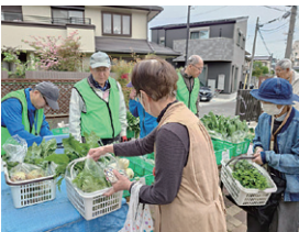
新鮮野菜を販売(岡町菜園)