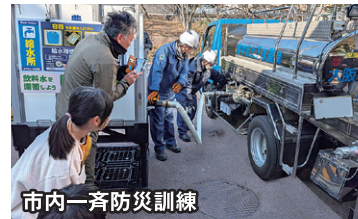
市内一斉防災訓練