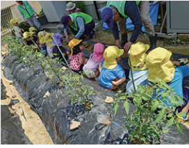
保育園児とのお芋植え(克明菜園)