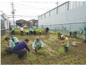
原田菜園での稲刈り