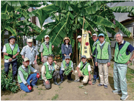
バナナを収穫(岡町第2菜園)