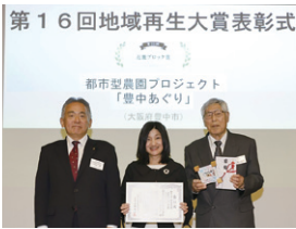
表彰式に出席しました

地域のつながりづくりや多世代交流の場として活動を続けてきた取り組みが高く評価されました。農作業や収穫体験を通じて、子どもから大人まで自然に関わり合える居場所を育んでおり、今後とも誰もが気軽に参加できる地域の場として活動していきます。