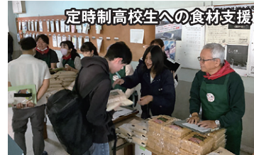
定時制高校生への食料支援