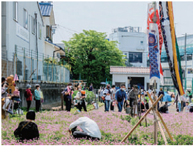
交流イベントいっぱい(あぐりパーク)