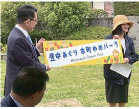
10カ所目の本町ゆめパーク