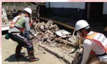
熊本地震への支援活動の様子。「とても助かった」と喜んでいただきました。