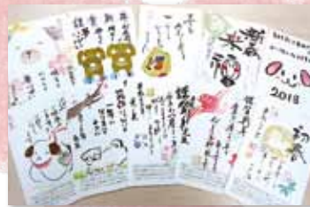
毎年心温かい年賀状をボランティアが作成し、70歳以上のひとり暮らし高齢者へ送ります。