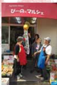
若者の就労体験の場、「ビーの×マルシェ」。オープンにあたり改修に活用しました。