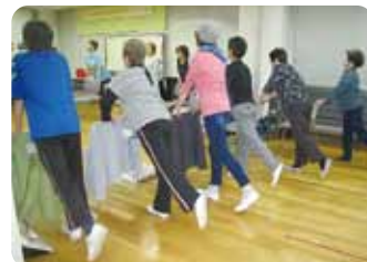
▲介護予防教室のようす

○デイサービスセンターふれあい高川 (事業所番号:2774004325) ☎ 06 (6335) 0668 FAX 06 (6333) 2812