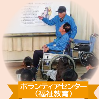
ボランティアセンター (福祉教育)