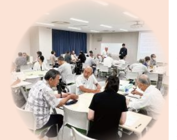
マンションサミット