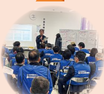
災害ボランティアセンター 設置訓練