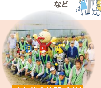
定年後の仲間づくり (あぐり)