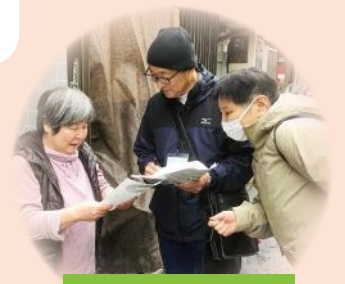
地域の見守り活動