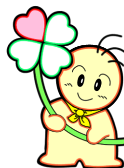
豊中のボランティア イメージキャラクター ボランちゃん