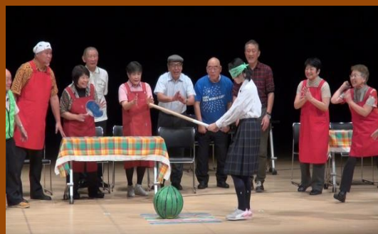
地域共生劇団「丸ごと劇団」による演劇